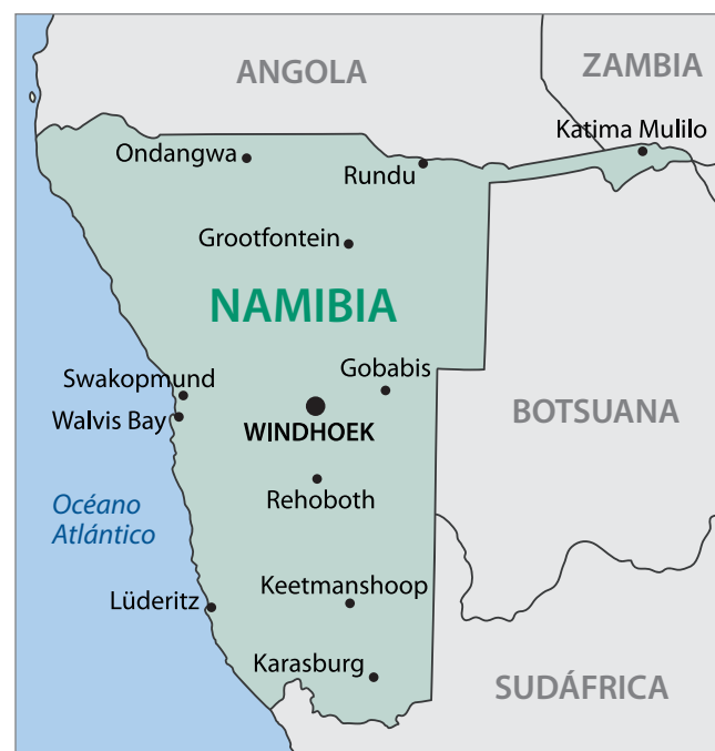
Figura 4.2: Mapa geográfico de Namibia.

La Constitución de Namibia establece la elección de un presidente como Jefe de Estado, por un mandato de cinco años. El Parlamento de Namibia está conformado por dos cámaras: la Asamblea Nacional y el Consejo Nacional. La economía de Namibia se basa en la extracción de uranio, oro, plata y metales básicos, como también en la agricultura y el turismo. Namibia es un estado miembro de las Naciones Unidas (ONU), la Unión Africana (UA), la Comunidad de Desarrollo de África Meridional (SADC), y la Mancomunidad de Naciones. La moneda de Namibia es el dólar namibio, aunque el rand sudafricano también es aceptado como moneda de curso legal.